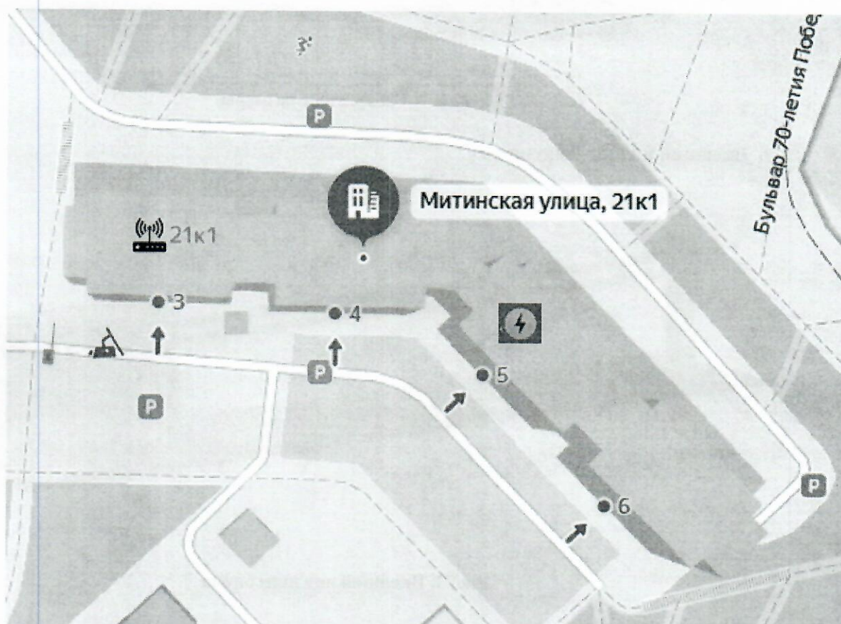
Рис. 1. Схема размещения шлагбаумов

г. Москва, Митинская улица, 21к1 - при въезде на дворовую территорию.