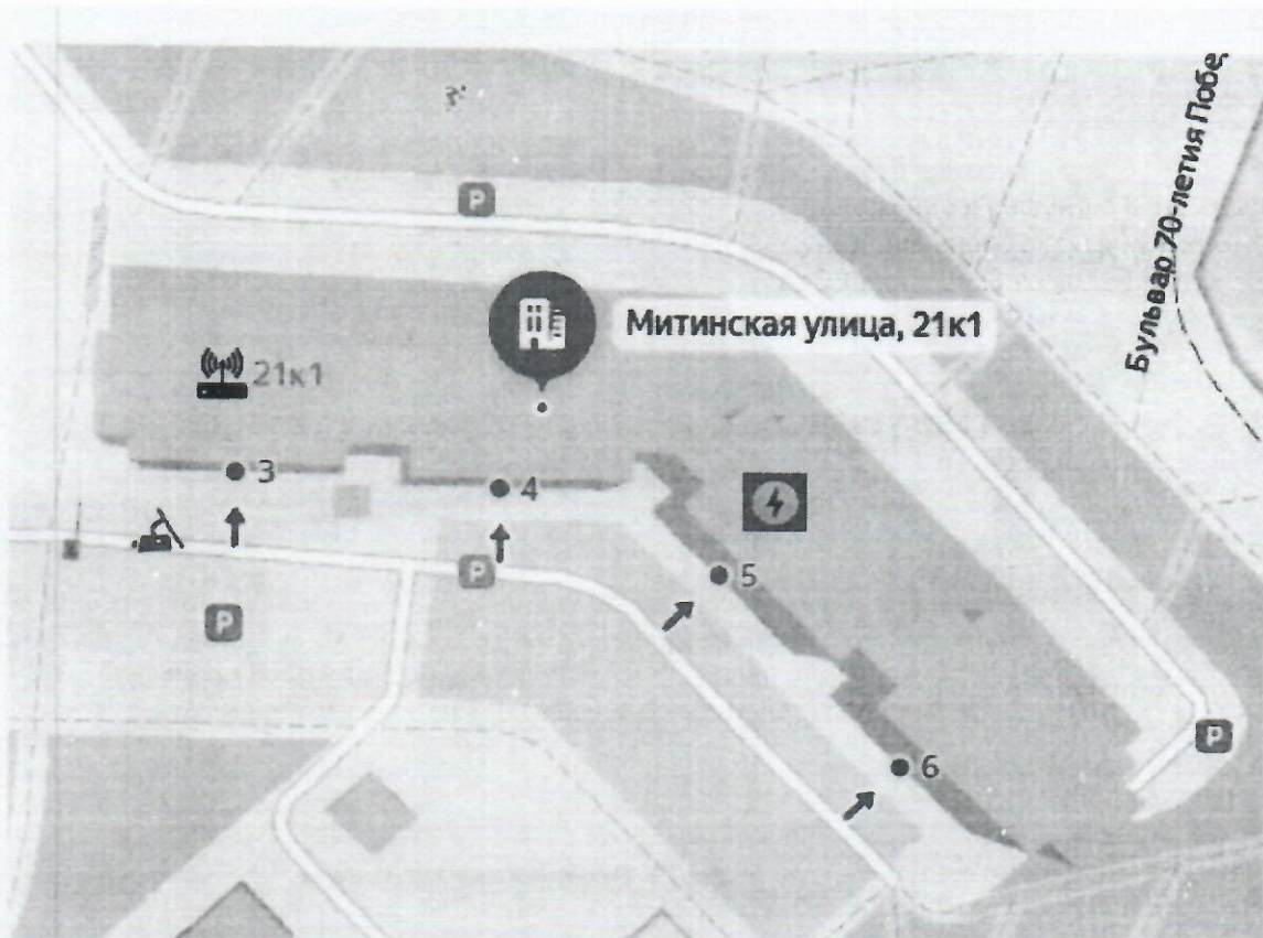
Рис. 1. Схема размещения шлагбаумов